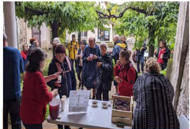
Pause et visite du Four à chaux de La Tour.