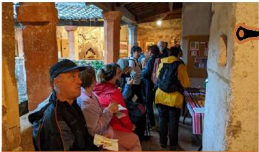
Pause et dégustation dans le cloître du prieuré de St-Xist.