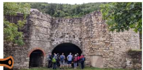
Pause et visite du Four à chaux de La Tour.