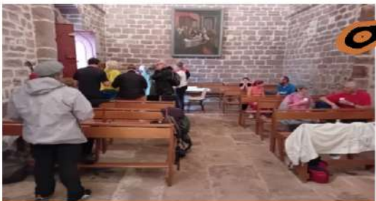
Pause et dégustation à l'intérieur de l'église Sainte-Marie de Frangouille.