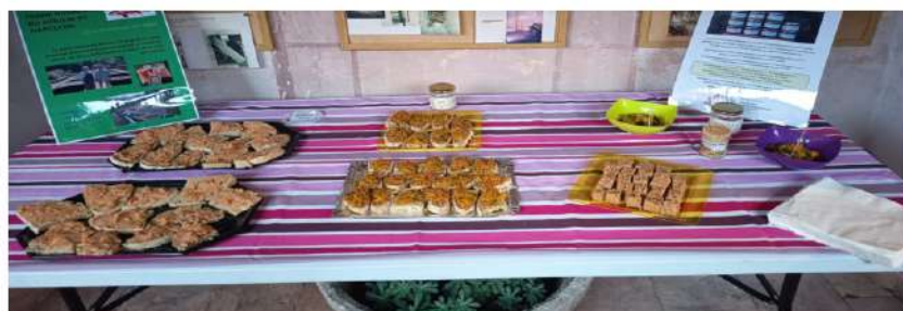
Les gourmandises de la pause au Prieuré de St-Xist.

Merci aux bénévoles des associations qui ont accueilli et fait visiter les différents sites. Merci aux bénévoles qui ont tenu les stands de dégustation, Merci aux bénévoles de l'association « Au four et au levain » qui ont guidé les groupes, aux équipes de choc qui ont préparé les pâtes, les pains et les pizzas. Merci aux associations partenaires : "Les amis du café de La Tour", "Les amis de St Pierre de Brousson", "Les amis du prieuré de St Xist", Les anciens membres de "L'église Bérengère de Frangouille", "Les amis du four à chaux". Merci à la commune pour son soutien. L'association « Au Four et au levain » réfléchit déjà à un nouveau parcours avec de nouvelles découvertes pour 2026.