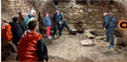
Le puits sous la bibliothèque dans le château de Brousson (actuel bâtiment de la Mairie).

Dimanche 21 septembre, l'association « Au four et au levain » a organisé, en collaboration avec cinq autres associations, la première randonnée patrimoine et gourmandises sur la commune de La Tour sur Orb.