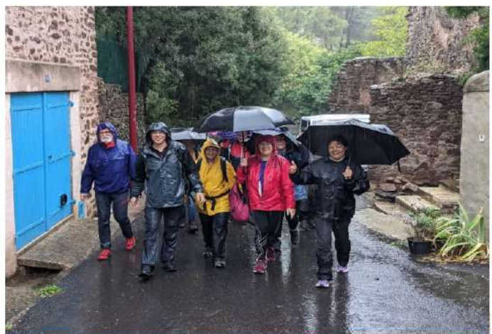
Arrivée du premier groupe à Frangouille.

Le plus étonnant furent la motivation et l'endurance des marcheurs à affronter les éléments difficiles avec détermination et courage, pas une plainte n'a été entendue, et malgré des habits détrempés on pouvait voir la présence de sourires sur les visages mouillés.